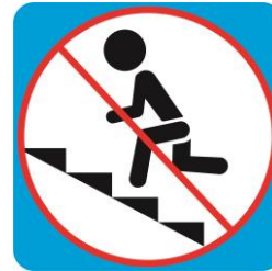
Бег на лестнице