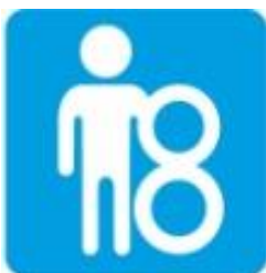
Пользоваться плавательным кругом