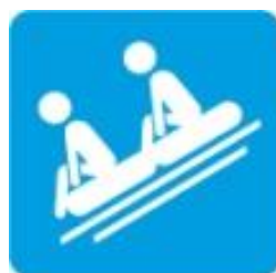
Спуск на круге