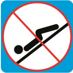
Положение на спине головой вперед