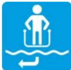
Направление выхода из зоны погружения