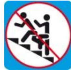
Обгон на лестнице