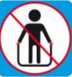
Держаться за края горки