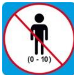
Ограничения по возрасту