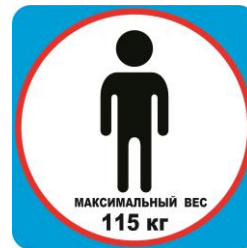
Максимальный допустимый вес