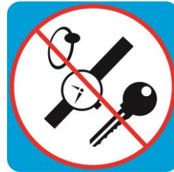
Скатывание с посторонними предметами