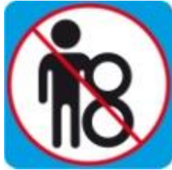
Спуск на двойном круге